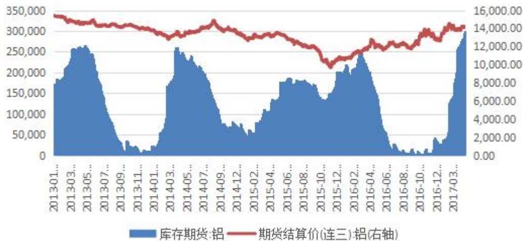
图 4：沪铝期货库存与价格