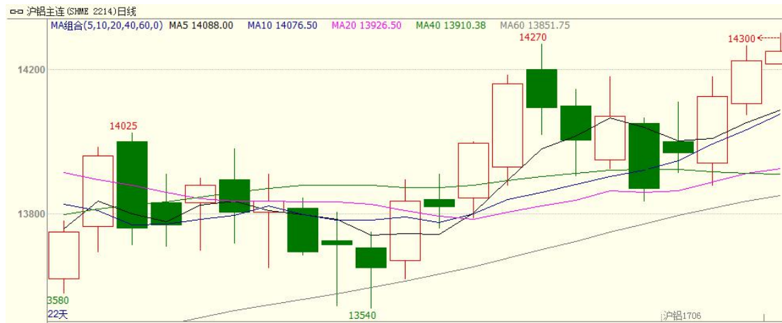
图 1:沪铝主力走势图

本周初，沪铝主力 1706 先抑后扬，最高价 14270，最低价 13835，收于 14225 元/吨，周涨幅 220 元或 1.57%。成交量增加 107.6 万手至 155.2 万手，持仓量增加 90926 手至 30.6 万手。