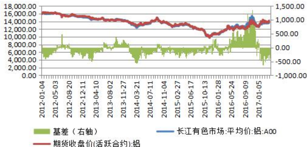
图 3：现货升贴水情况